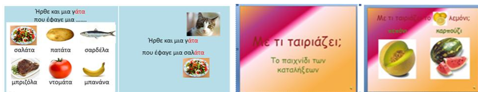
Εικόνα 2: Παιχνίδια με τις λέξεις

Δραστηριότητα 5 : Οι νηπιαγωγοί στο πρόγραμμα power point δημιούργησαν τα παρακάτω παιχνίδια (Εικόνα 2):